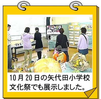
10月20日の矢代田小学校文化祭でも展示しました。

受賞作品・賞状はふれあい会館内や矢代田駅自由通路にも展示しています。 地域をつないだ活動成果を見に来てください!