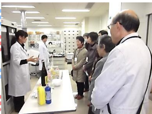
身近なテーマ故、皆さん真剣な眼差しです。